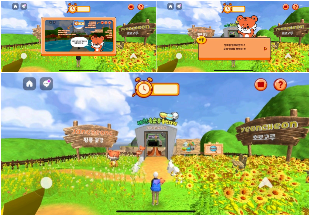
▲ Tiger Mountain 갈무리