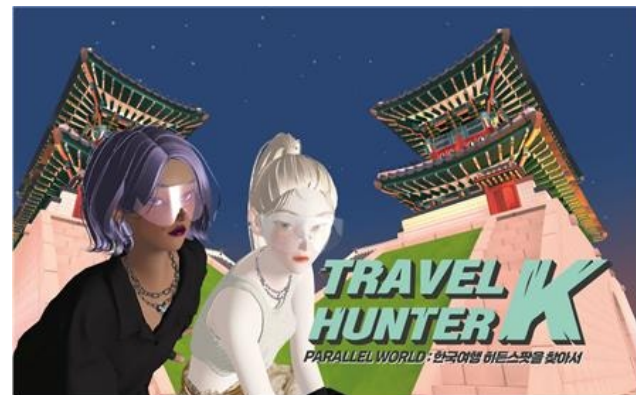
[▲ 제페토 트레블 헌터]

올해 초, 한국관광공사는 사업계획 설명회를 통해 메타버스 플랫폼을 활용한 '한국 관광 그랜드 맵' 조성 및 공동 마케팅 계획을 발표했습니다. 그리고 지난 10일, 문화체육관광부와 한국관광공사는 아시아 최대 메타버스 플랫폼인 '제페토'에서 지역관광 홍보를 위한 한국관광 테마 월드 시리즈를 출시했습니다.